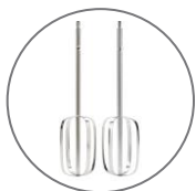
2x šlehací metla