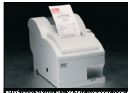
NOVÉ verze tiskárny Star SP700 s převíjením papíru