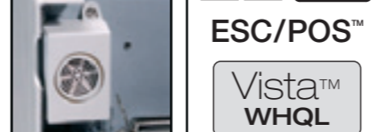
Snadno instalovatelný volitelný bzučák