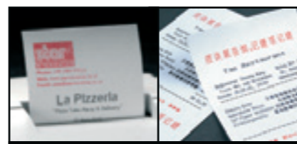
Dvoubarevný výstup, tisk grafiky ve vysoké kvalitě