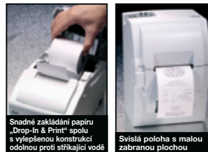
Snadné zakládání papíru „Drop-In & Print“ spolu s vylepšenou konstrukcí odolnou proti stříkající vodě

Všechny modely jsou k dispozici v bílé Star nebo v úhlově šedé barvě s výběrem sériového, paralelního nebo USB rozhraní (s certifikací WHQL) nebo bez rozhraní.