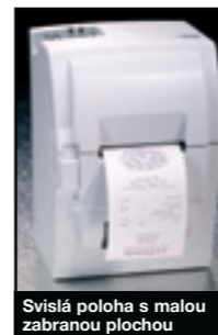
Svislá poloha s malou zabranou plochou