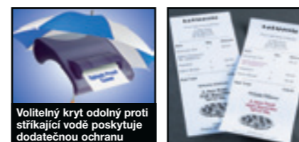
Volitelný kryt odolný proti stříkající vodě poskytuje dodatečnou ochranu