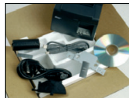
Příslušenství, které je součástí balení při koupi – napájecí a připojovací kabely, sada pro montáž na zeď nebo ve vertikální poloze, vodítko papíru pro šířku 58 mm, disk CD se softwarem pro instalaci a dalším softwarem s přidanou hodnotou