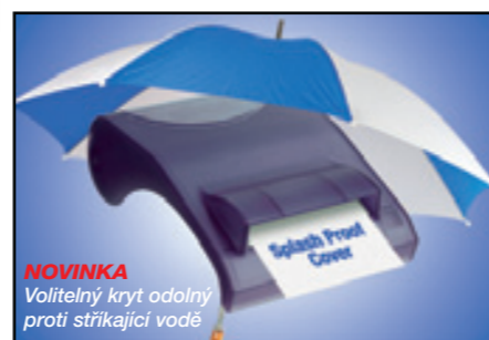
NOVINKA Volitelný kryt odolný proti stříkající vodě