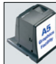
Volitelný podstavec uhlově šedé barvy se zabudovanou funkcí grafiky formátu A5