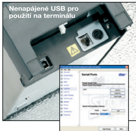
Nenapájené USB pro použití na terminálu

Při náhradě tiskárny pro jednu pracovní stanici se sériovým rozhraním nastavte tiskárnu podle instrukcí, vyměňte kabel rozhraní za kabel USB a vytvořte virtuální sériový port s použitím průvodce společnosti Star, kterého najdete ve stránkách vlastností tiskárny TSP100 pod položkou „Konfigurace TSP“. Společnost Star vám na požádání poskytne jednoduché řešení pro náhradu tiskárny s paralelním rozhraním.