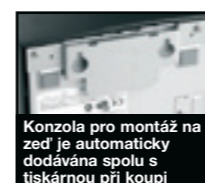
Konzola pro montáž na zeď je automaticky dodávána spolu s tiskárnou při koupi