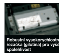
Robustní vysokorychlostní řezačka (gilotina) pro vyšší spolehlivost