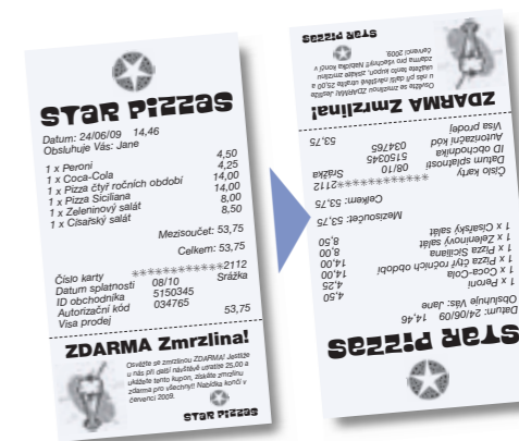
Automatické otočení textu – Auto-Text Reversal™

...další tiskárny řady TSP100 jsou na stránkách 10 a 11, spolu s výčtem funkcí a specifikací tiskáren.