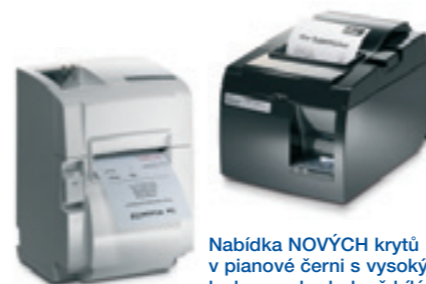
Nabídka NOVÝCH krytů v pianové černi s vysokým leskem nebo ledově bílé